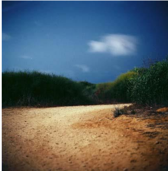
דבר דומה מתרחש בתצלום אחרי המלחמה, 2006 מסדרה אחרת: